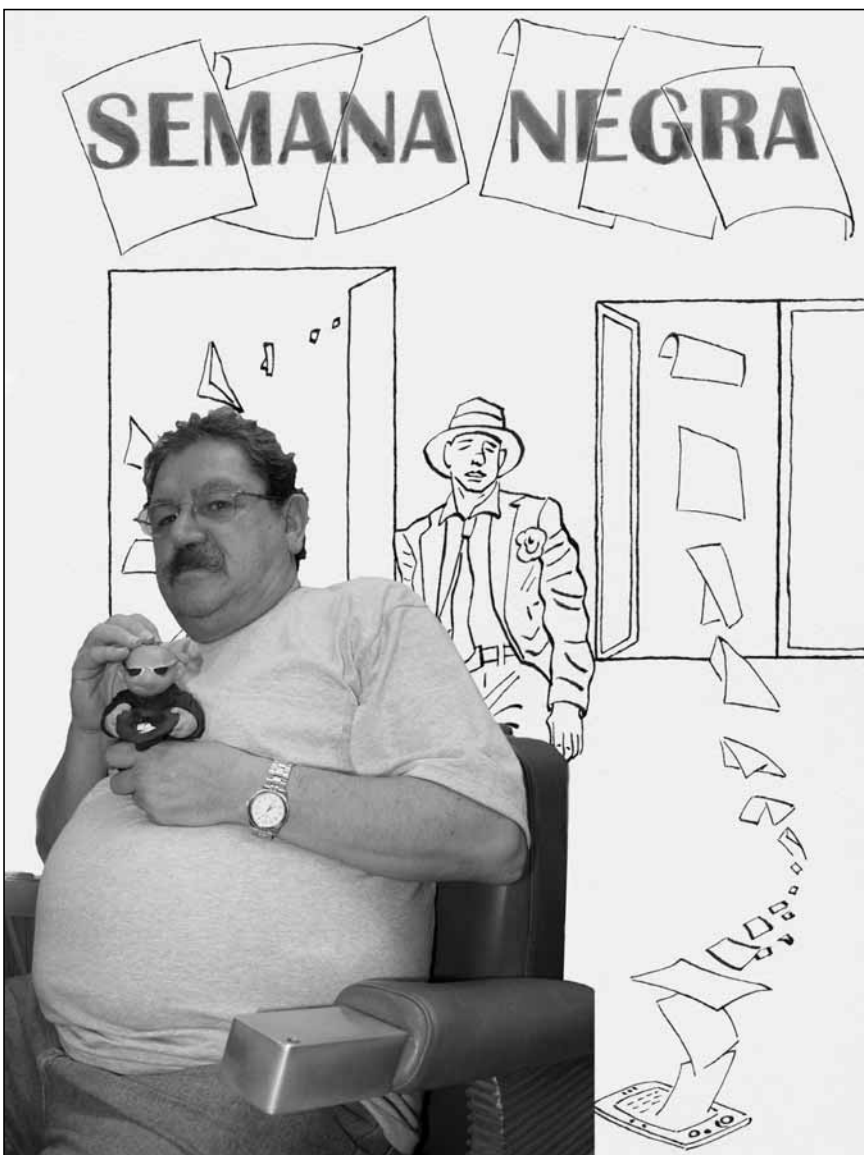
Paco Ignacio Taibo II director de la SN con el Rufo 2010.