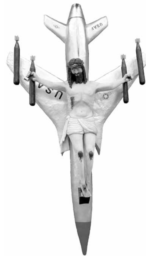
LA CIVILIZACIÓN OCCIDENTAL Y CRISTIANA León Ferrari, 1965

En 1965 se le pidió al artista argentino León Ferrari (Buenos Aires 1921), que participase en el Premio Nacional del Instituto Torcuato Di Tella (el faro del arte contemporáneo en Latinoamérica durante los años sesenta). Ferrari era conocido por sus obras con alambre y su famosa, en los círculos de arte, Carta a un General .